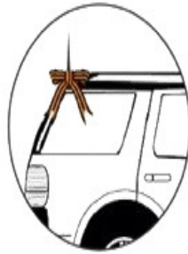
на антенну автомобиля